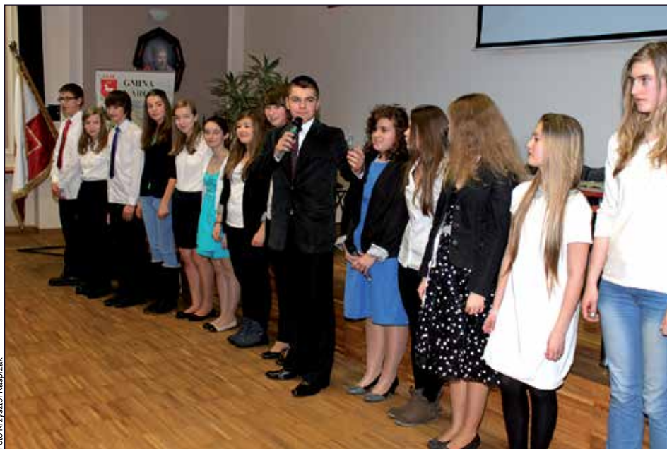
Zespół aktorski, który przedstawił w krzywym zwierciadle naradę burmistrza z kadrami kierowniczą urzędu

2. Na terenie Gminy Karczew zabronione jest pozostawianie psa bez dozoru, jeżeli nie jest on należycie uwiązany lub nie znajduje się w pomieszczeniu zamkniętym albo na terenie ogrodzo-