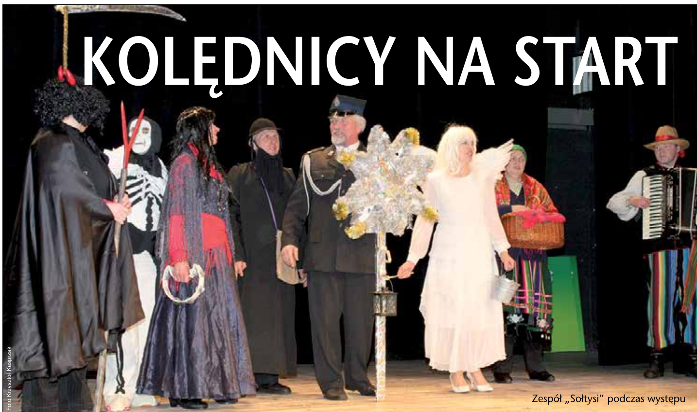
Zespół „Sołtysi” podczas występu