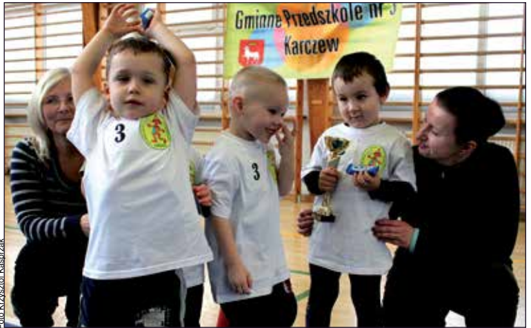
Wśród trzylatków puchar zdobyli zawodnicy Przedszkola nr 3 „Ługuś”