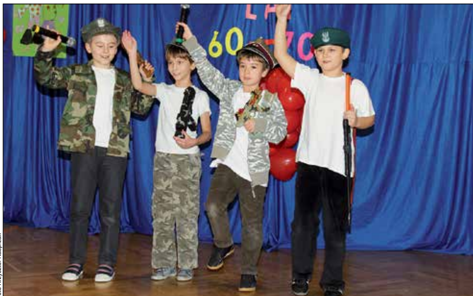
„Przyjedź mammo na przysięgę”