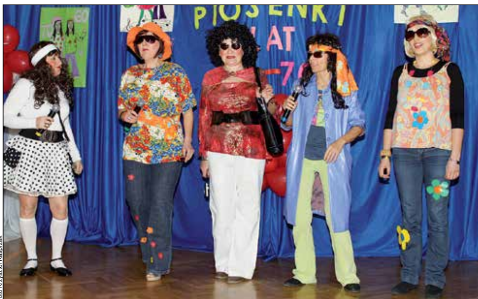
Jury konkursowe prawie w pełnym składzie.