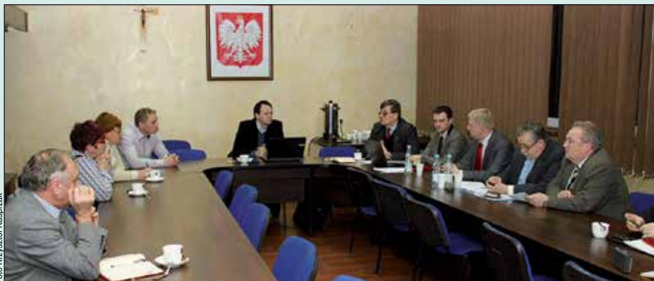
Posiedzenie Komisji ds. Rozwoju Gospodarczego i Ochrony Środowiska

wać, sfinansować i zarządzać tą oczyszczalnią mając oczywiście na względzie systematyczny zwrot nakładów inwestycyjnych. Jak zapowiedział, firma jest w stanie zagwarantować w umowie, że odbiór ścieków będzie przez cały okres eksploatacji oczyszczalni przez Remondis tańszy niż w Otwocku i to nie o grosz czy dziesięć groszy.