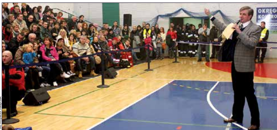
Licytacje prowadzi znany prezenter radiowy i telewizyjny Zygmunt Chajzer