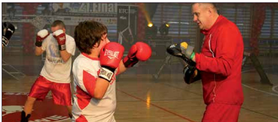
Pokaz boksu w wykonaniu zawodników i trenerów karczewskiej „GARDY”

Impreza zakończyła się turniejem piłkarskim, w którym zmierzyły się drużyny Komendy Głównej Policji, Mazura Karczew, Komendy Powiatowej Policji w Otwocku i samorządowców. Turniej wygrał Mazur Karczew pokonując w finale piłkarzy Komendy Głównej Poli-