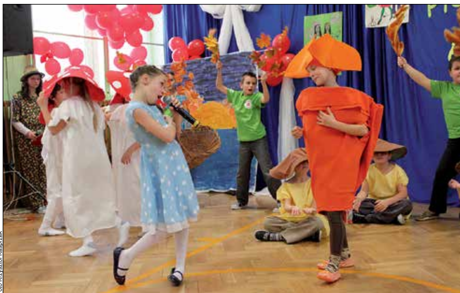
Rudy, rudy, rudy rydz, mam na rydza smaczek ...