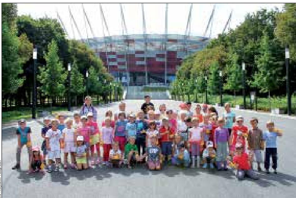
Zdjęcie pamiątkowe przed Stadionem Narodowym w Warszawie