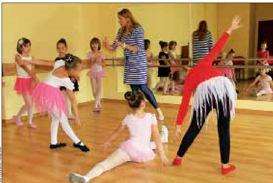
Grupa starsza podczas ćwiczeń