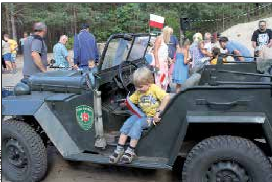
Jednym z eksponatów wystawy był samochód EKO PATROLU