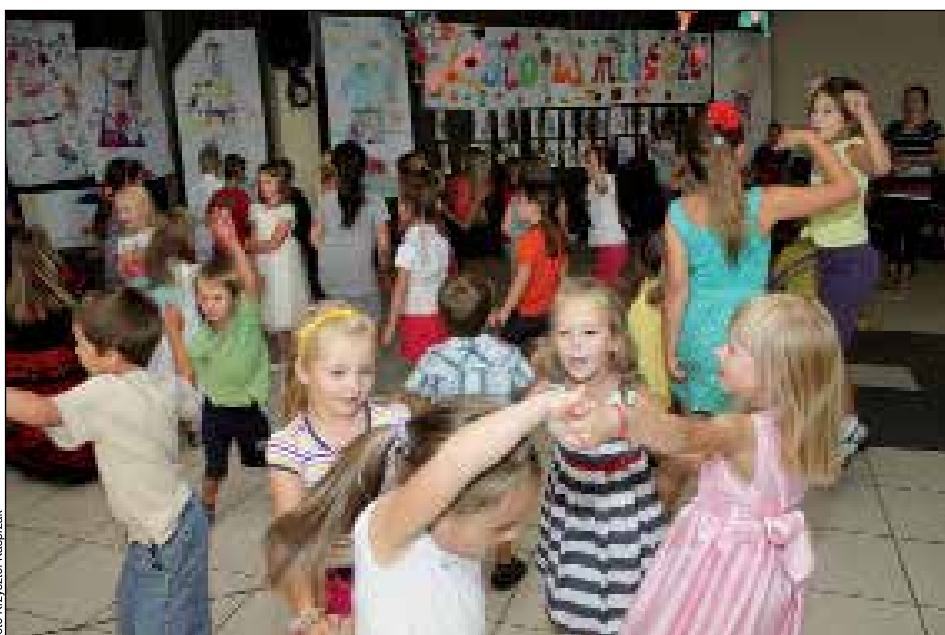
Tak bawiły się dzieci w MGOK na zakończenie akcji letniej