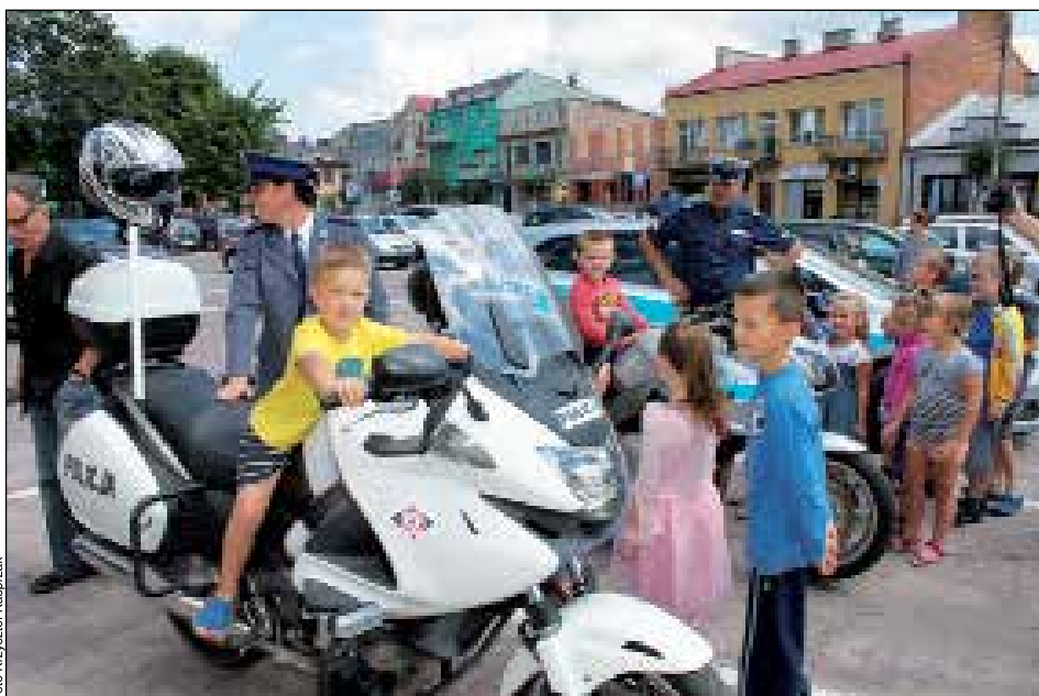
Każdy chciał usiąść na policyjnym motocyklu

Akcja „Lato w Mieście” już za nami, ale za rok wrócimy do tego tematu. Rok czasu jest na to, by zastanowić się co zrobić, żeby wypoczynek dzieci był jak najciekawszy, propozycje w pełni przez wypoczywających akceptowane, a przy tym żeby było bezpiecznie. Coraz więcej bowiem dzieci pozostaje na wakacje w domu, i dla nich trzeba przygotować naprawdę dobrą i przemyślaną ofertę. (KK)