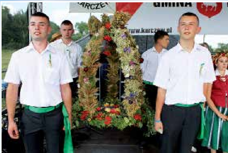
Całowańska młodzież z dożynkowym wieniec