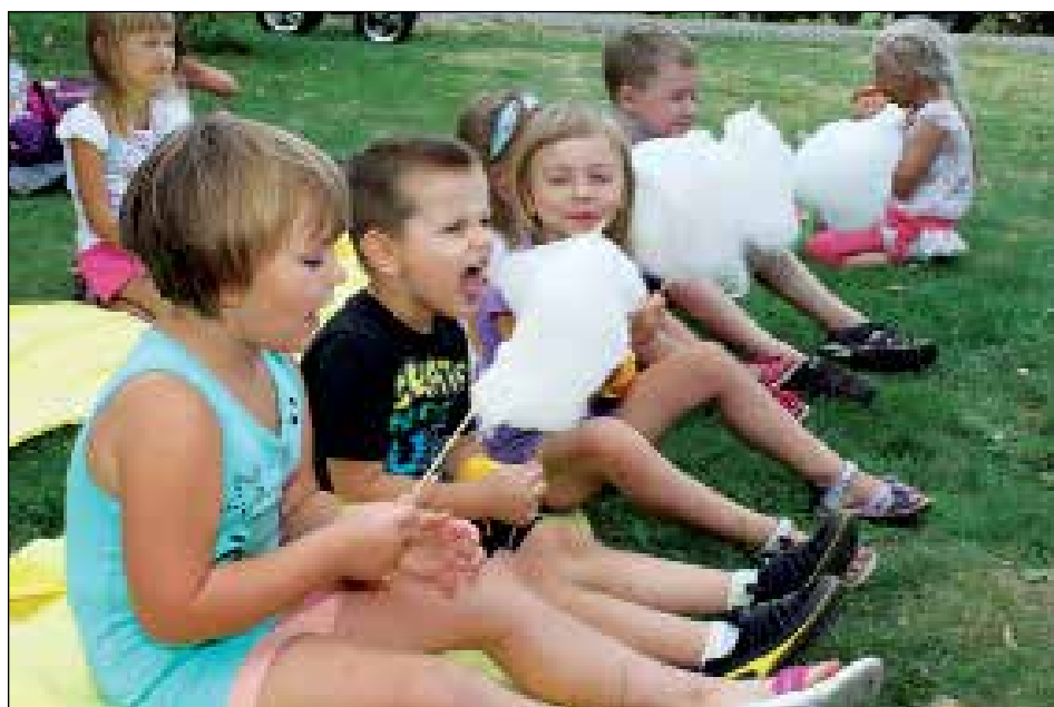
Wata cukrowa była wspaniała

W tym roku akcję letnią, oprócz Miejsko Gminnego Ośrodka Kultury w Karczewie, organizował także MOSiR oraz animatorzy sportowi pracujący w Sobiekursku na zespole obiektów sportowych „ORLIK”. Najciekawsza oferta wakacyjna została przygotowana przez pracowników MGOK Karczew. Ponieważ placówka ta rokrocznie organizuje dzieciom czas wolny w sposób bardzo atrakcyjny, nic więc dziwnego, że w tegorocznych zajęciach akcji letniej uczestniczyło nawet do setki dzieci.