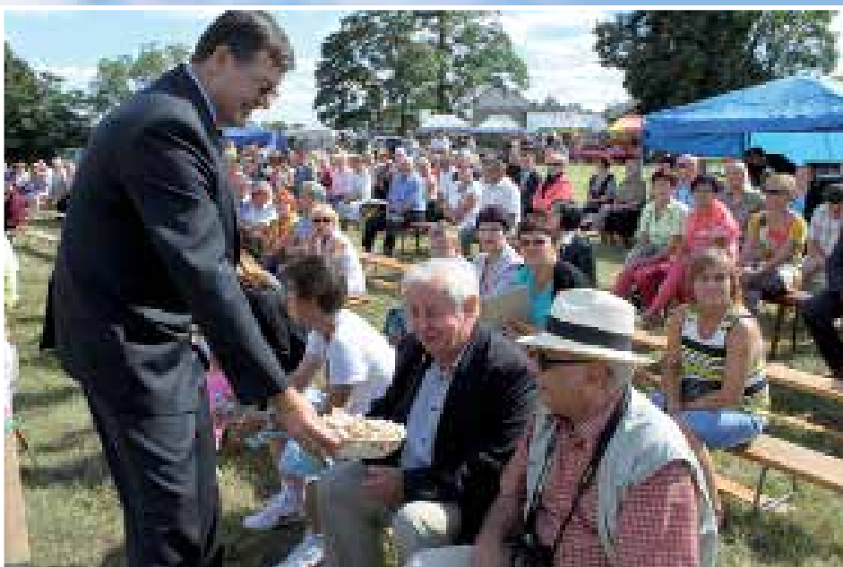
Każdy uczestnik całowańskiego święta plonów został poczęstowany dożynkowym chlebem

ynek należą się słowa uznania. Impre- ozmachem, a przygotowane atrakcje (K) Foto Krzysztof Kasprzak