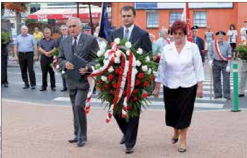
EKO PATROL podczas patriotycznej manifestacji z okazji 69 rocznicy Powstania Warszawskiego