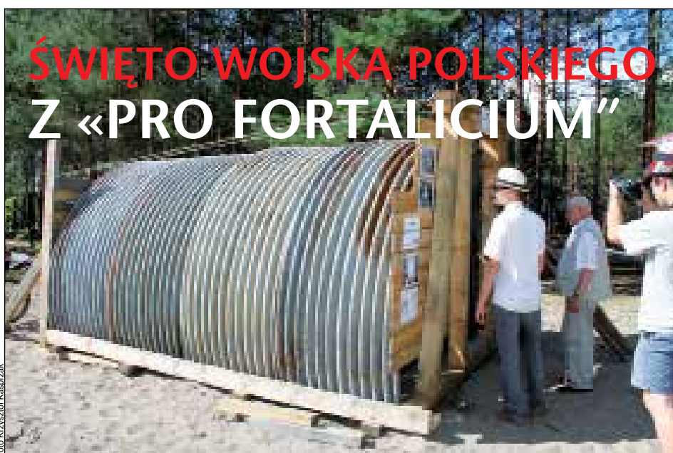
Schron bierny z blachy falistej i drewna wyprodukowany w 1915 roku

Tak jak poprzednie spotkania, tak i ten piknik na Dąbrowieckiej Górze był imprezą bardzo udaną i choć tego dnia odbywało się kilka imprez konkurencyjnych, to ci, którzy zdecydowali się Dzień Wojska Polskiego spędzić w gronie pasjonatów fortyfikacji i uzbrojenia przyznawali zgodnie, że dokonali dobrego wyboru. Przecież wystawy na Dąbrowieckiej Górze są jedynym miejscem w powiecie otwockim, gdzie eksponaty muzealne można wziąć do ręki i nikt nie krzyczy.(KK)