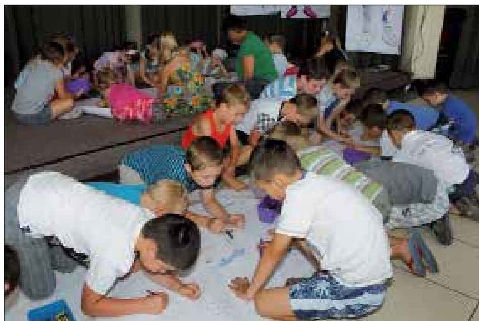
Najwygodniej malowało się dzieciom na podłodze