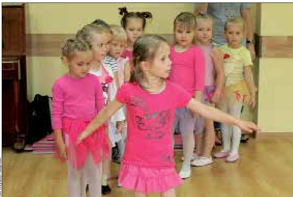
Tak ćwiczyły dzieci z grupy młodszej

Wraz z początkiem września wznowione zostaną zajęcia baletowe. Pamiętajmy, że balet uczy dzieci płynności ruchów, zręczności, wdzięku, wpływa na poprawienie tak bardzo potrzebnych w szkole koncentracji i samodyscypliny. (red)