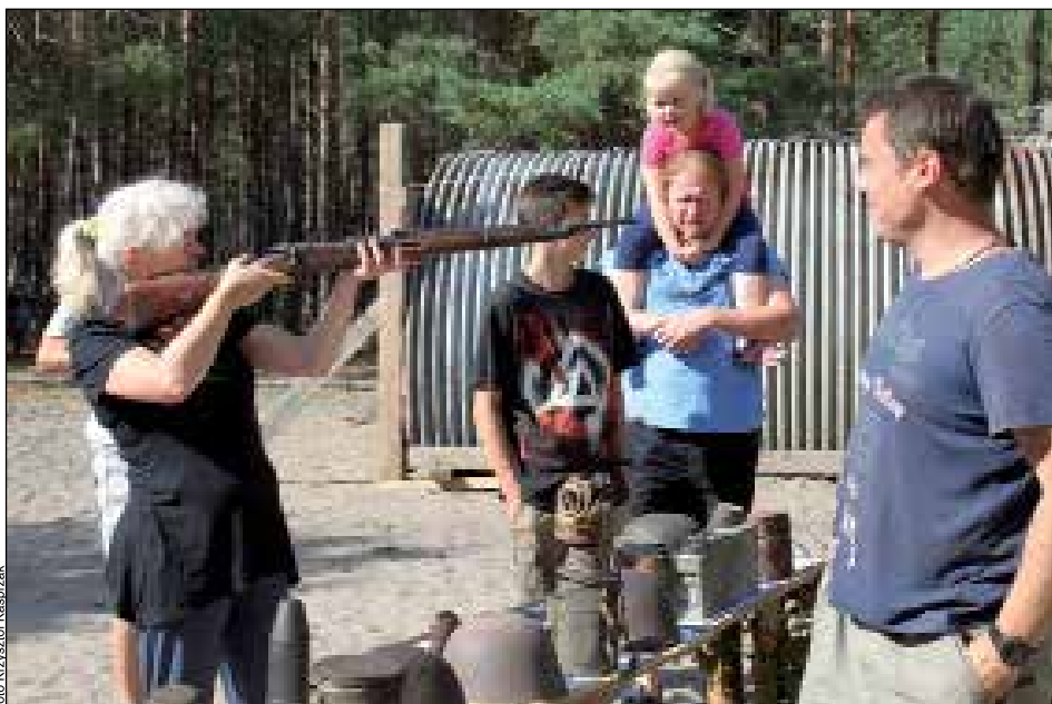
Na wystawie przygotowanej przez Pro Fortalicium można było bezkarnie dotykać każdego eksponatu