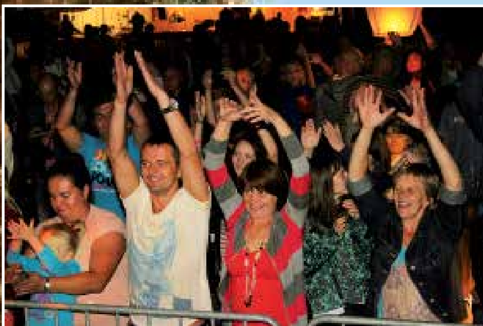
Tak się bawiono podczas wieczornego koncertu