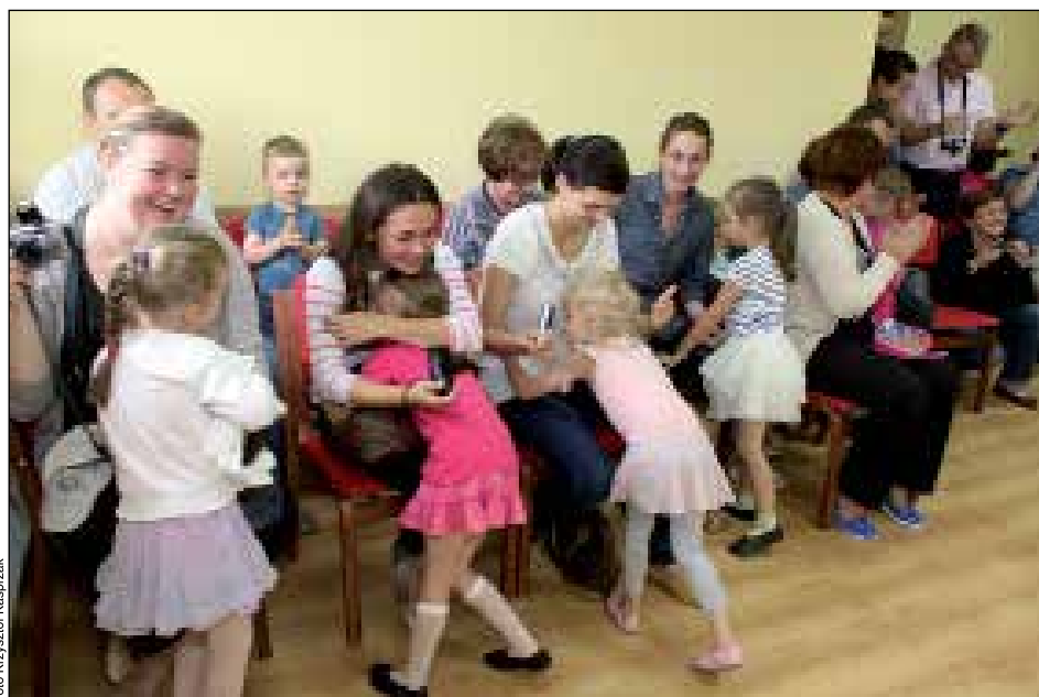
Najważniejsze dla dzieci są słowa uznania rodziców