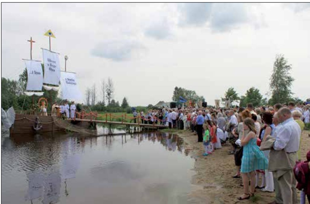
Ołtarz wybudowany przez wędkarzy na jeziorze Moczydło zachwycił wszystkich