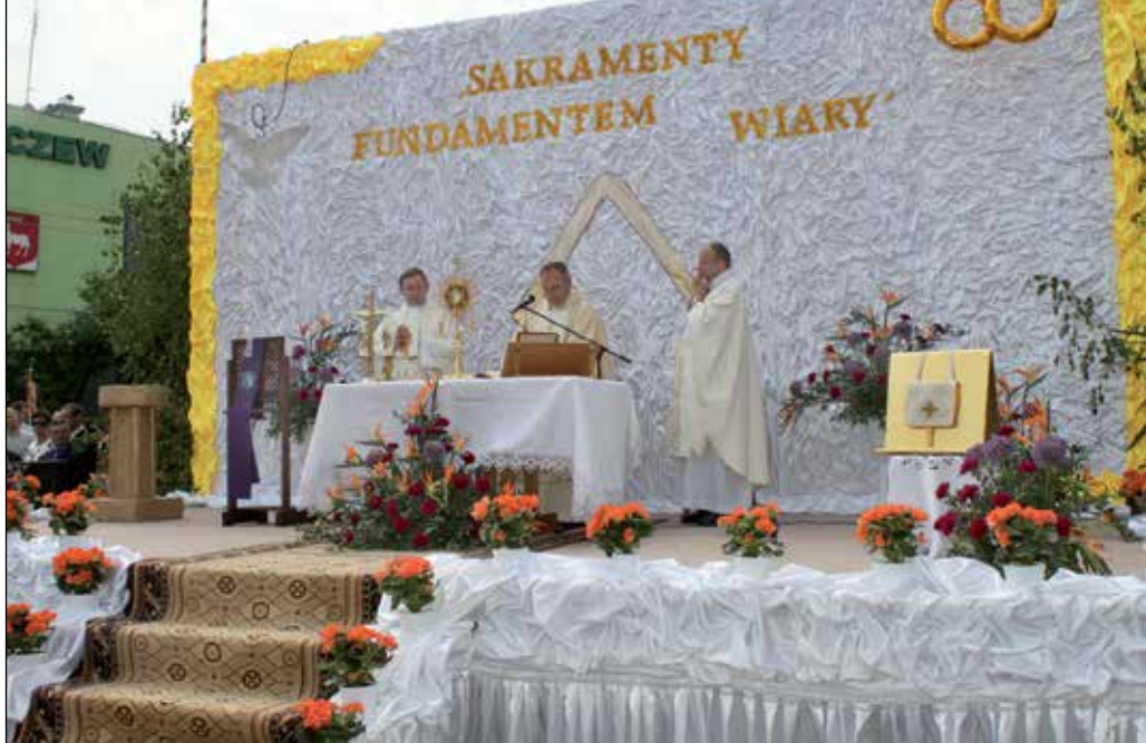
Ołtarz SAKRAMENTY FUNDAMENTEM WIARY, który stanął na Rynku Zygmunta Starego, wybudowali mieszkańcy Ostrówca

amorządowych Karczewa wszystkim fun- m Grupy Remontowej i Strażakom skła-