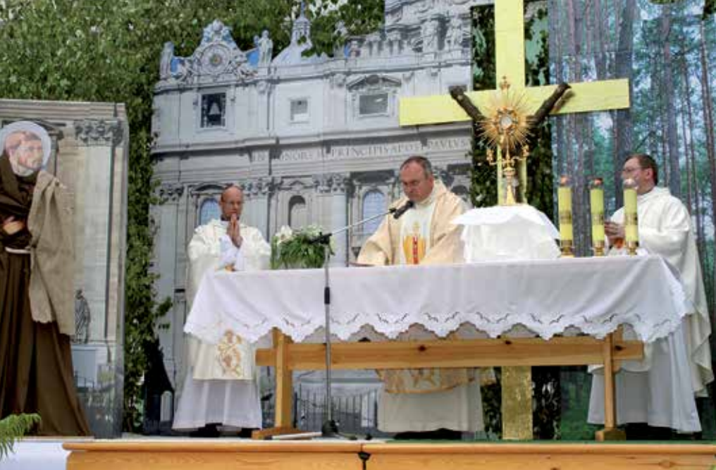
Ołtarz ufundowany przez Bank Spółdzielczy w Karczewie poświęcony był papieżowi Franciszkowi