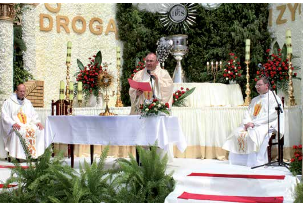
Przy ołtarzu wybudowanym w wejściu do Urzędu Miejskiego