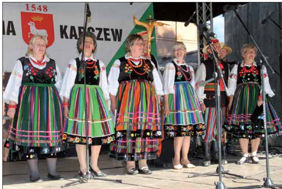
Zespół ludowy Sołtysi podczas występu

świątlika czeka na rozpoczęcie aktywnej działalności. Zmieniają się także placówki oświatowe tak w samym Karczewie, jak i na terenie wiejskim. Rozpoczęta została termomodernizacja szkoły w Otwocku Wielkim. W tym roku także zo-