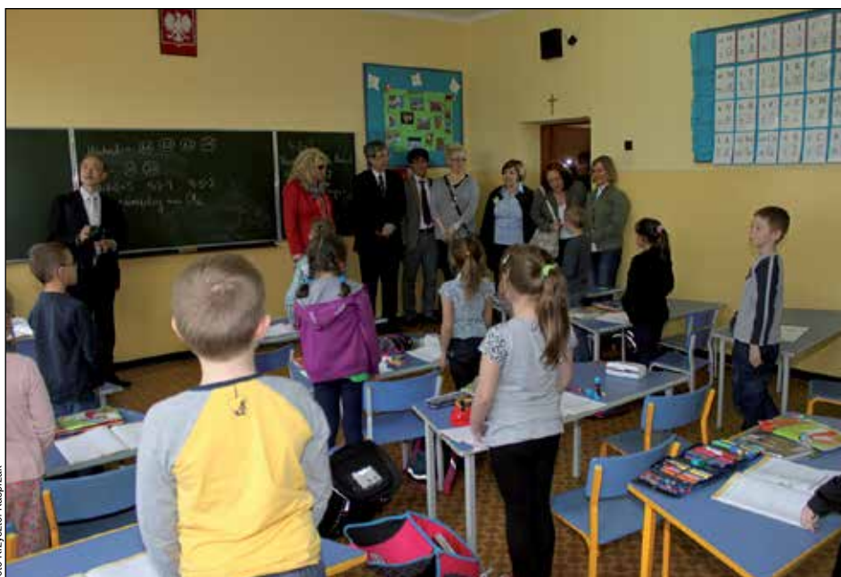
Przy okazji zapoznawania się ze stanem technicznym klas spotkanie z uczniami