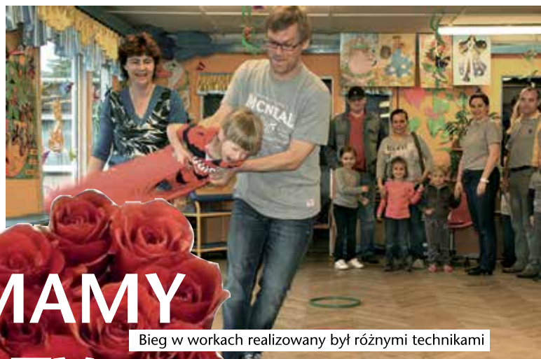
Bieg w workach realizowany był różnymi technikami