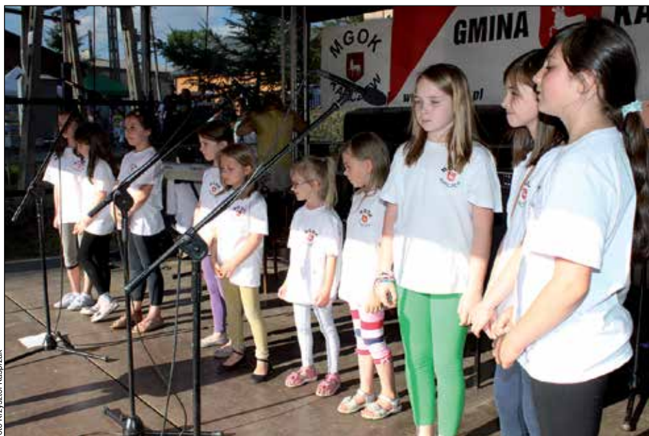
Na estradzie Święta Ludowego występowały dzieci z zespołu Gębule

Okolicznościowe przemówienie wygłosił Burmistrz Karczewa Władysław Dariusz Łokietek, który mówiąc o przeobrażeniach jakie następują na terenie wiejskim powiedział między innymi: Wieś ulega zmianie. Inaczej niż przed laty wyglądają obejścia gospodarskie. Kwiaty w ogródkach, krzewy ozdobne, krótko przystrzyżone trawniki – to coraz częstszy obraz spotykany na terenie wiejskim. Zmieniają się także świetlice wiejskie, ta w Ostrówcju również. Udało się ożywić te wiejskie placówki kulturalne w Janowie i Brzezince, Całowaniu i Piotrowicach. W Nadbrzeżu odnowiona