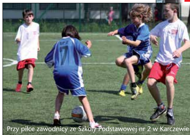
Przy piłce zawodnicy ze Szkoły Podstawowej nr 2 w Karczewie