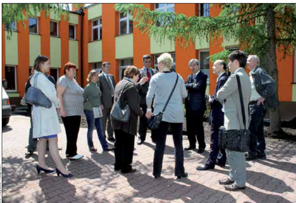
W Otwocku Wielkim przy wejściu do przedszkola