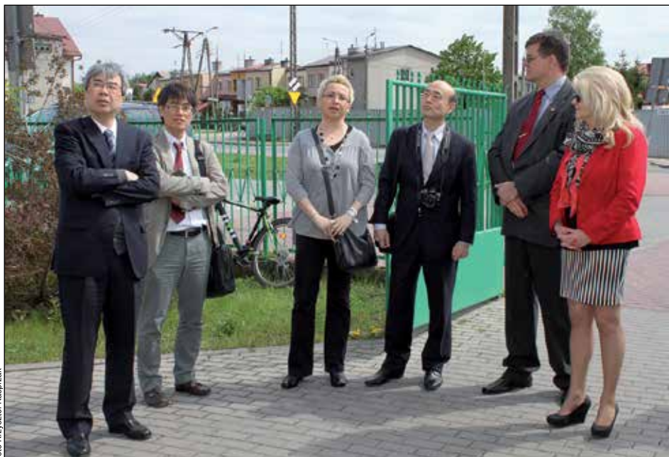
Delegacja Japonii przed Szkołą Podstawową nr 2 w Karczewie

Japońscy goście byli mile zaskoczeni zastosowanymi w Karczewie rozwiązaniami technicznymi, podkreślali, że nie spodziewali się takich nowoczesnych i kompleksowych rozwiązań. Goście zwiedzili również Szkołę Podstawową nr 2 w Karczewie oraz Zespół Szkolno Przedszkolny w Otwocku Wielkim. (red)