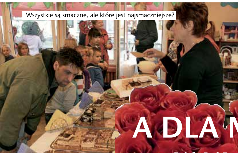
Wszystkie są smaczne, ale które jest najsmaczniejsze?

Impreza, mimo nieprzyjemnej pogody, udała się i organizatorom należą się gratulacje. Miejmy nadzieję, że następna impreza w przedszkolu na Buczka będzie odbywała się przy słonecznej pogodzie czego dzieciom i organizatorom serdecznie życzymy.(red)