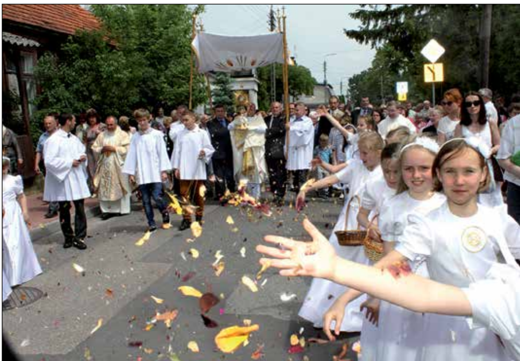
Procesja Bożego Ciała podczas przejścia ulicą Bilińskiego