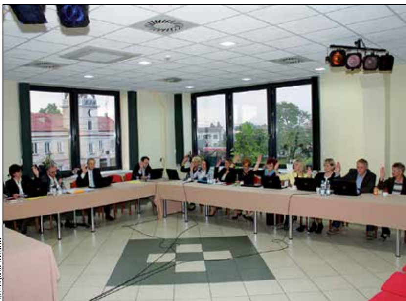
Uchwała o absolutorium dla Burmistrza Karczewa została przyjęta jednogłośnie