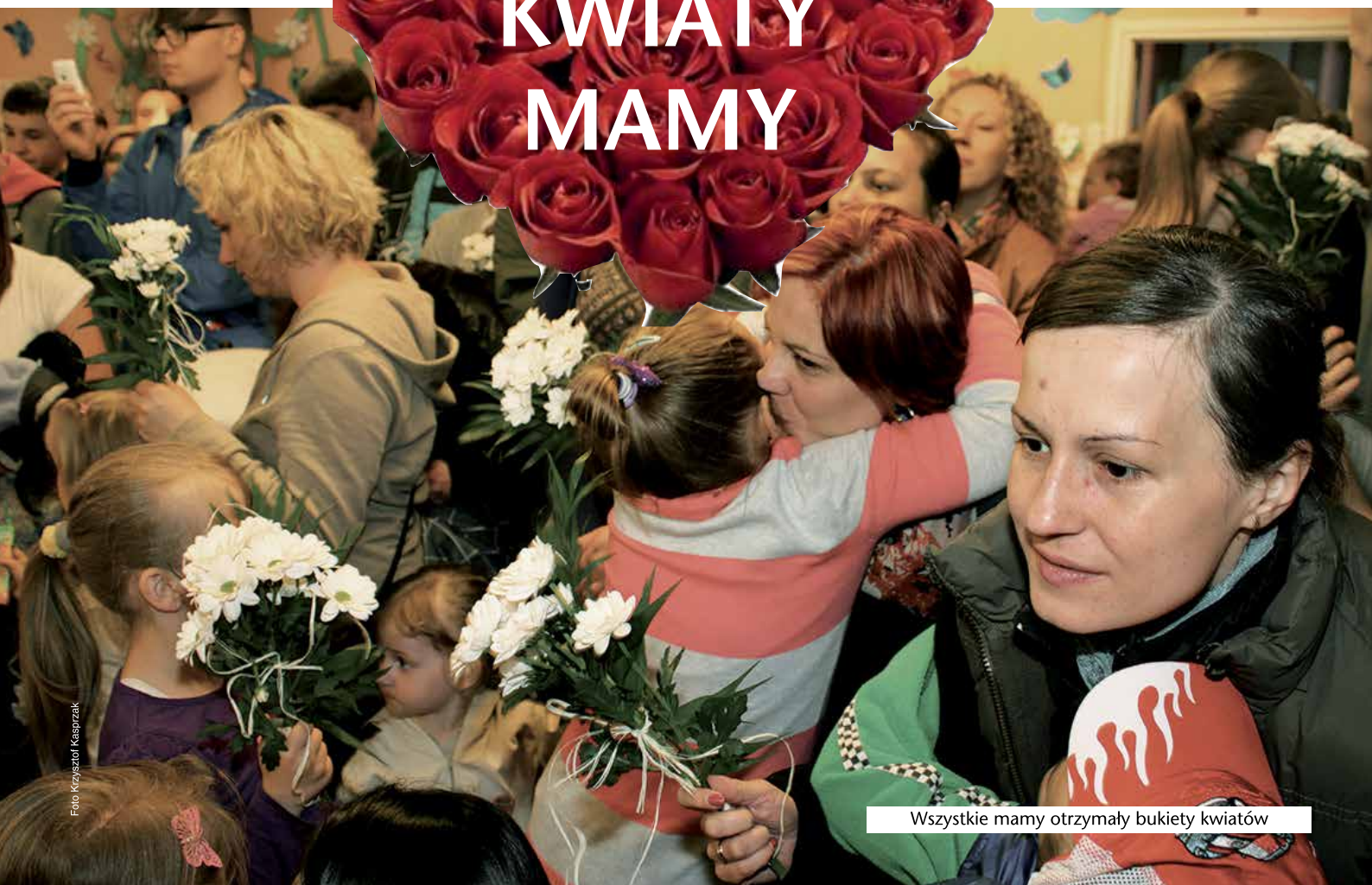
Wszystkie mamy otrzymały bukiety kwiatów