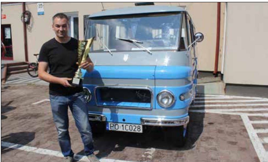
Laureat nagrody „Stylu i prestiżu” ze swoim wspaniałym żukiem

P ierwszy dzień tegorocznych „Dni Karczewa” rozpoczął się wspaniałą przygodą z zabytkowymi samochodami. Przed laty w Karczewie spotykały się na zlocie stare Syrenki i Warszawy, w tym roku na karczewskim rynku królowały natomiast samochody dostawcze. Karczew bowiem był miejscem startu II Rajdu Żuka. Imprezę zorganizowali: Stowarzyszenie Miłośników Transportu Dawnego „Nasz Tor”, Klub Samochodowy „Bikiniarze”, inicjatywa „Skarb Narodu” oraz Gmina Karczew.