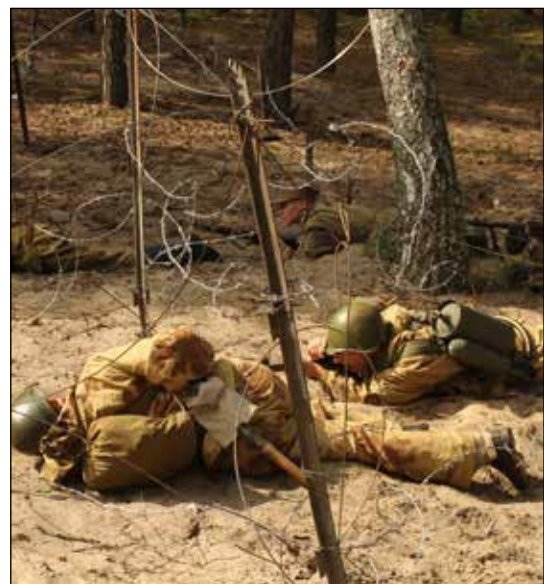
Żołnierze radzieccy na przedpolu schronu pokonują zasieki z drutu kolczastego