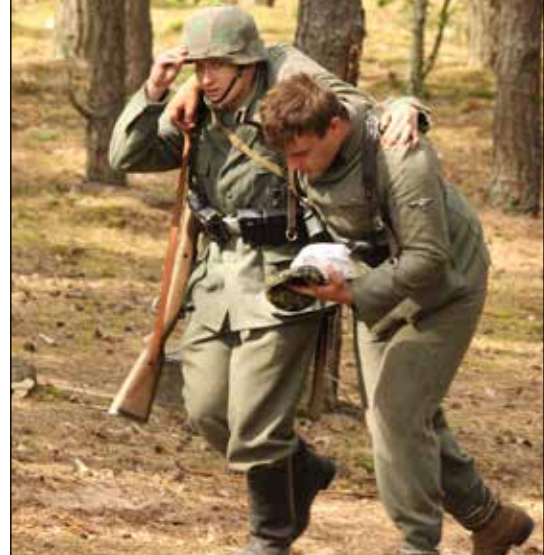
Po pierwszym starciu żołnierze niemieccy uciekają w stronę schronu