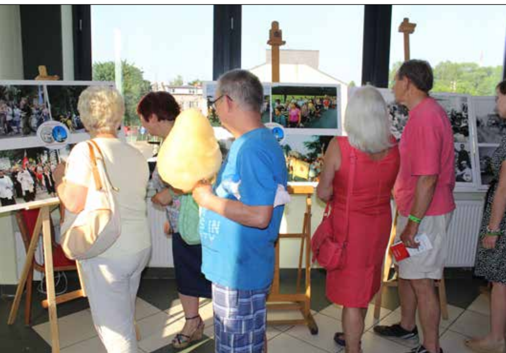
Wystawę o karczewskich pielgrzymach zwidziło bardzo dużo osób