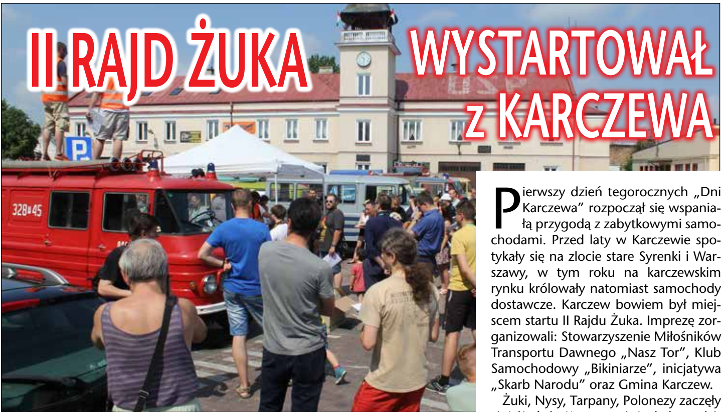
Na karczewskim rynku zaroilo się od starych samochodów i ich kierowców