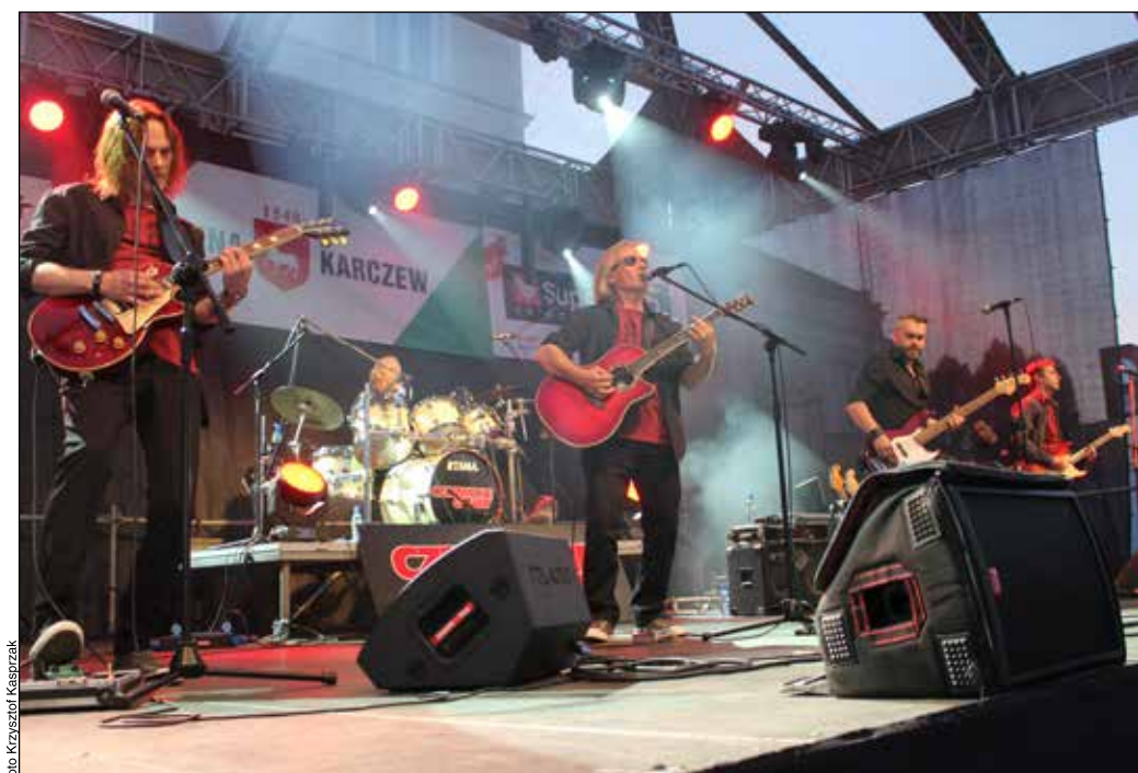
Występ Czerwonych Gitar