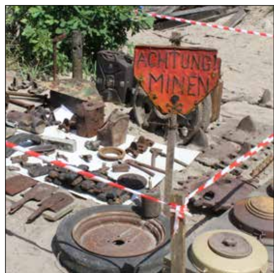
Nie była to jedyna wystawa sprzętu i uzbrojenia z okresu II wojny światowej