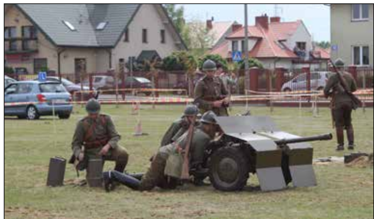
Przygotowanie do pokazu