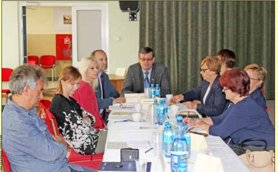
Podczas śniadania prasowego rozmawiano o organizacji bezpiecznych wakacji na terenie Gminy Karczew