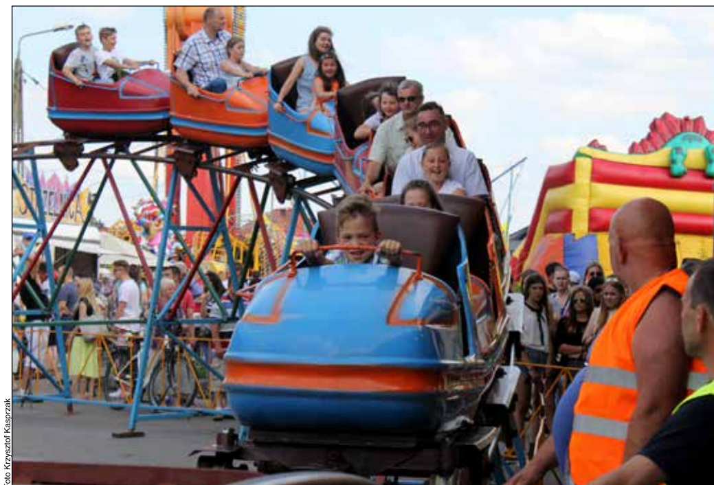
Podczas zabaw w wesołym miasteczku