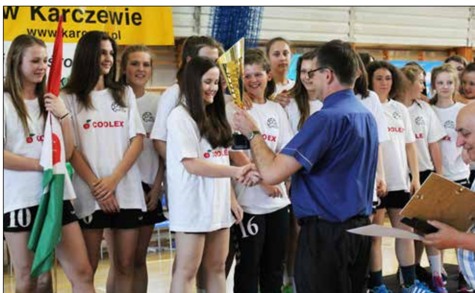
Puchar za zdobycie trzeciego miejsca także cieszy