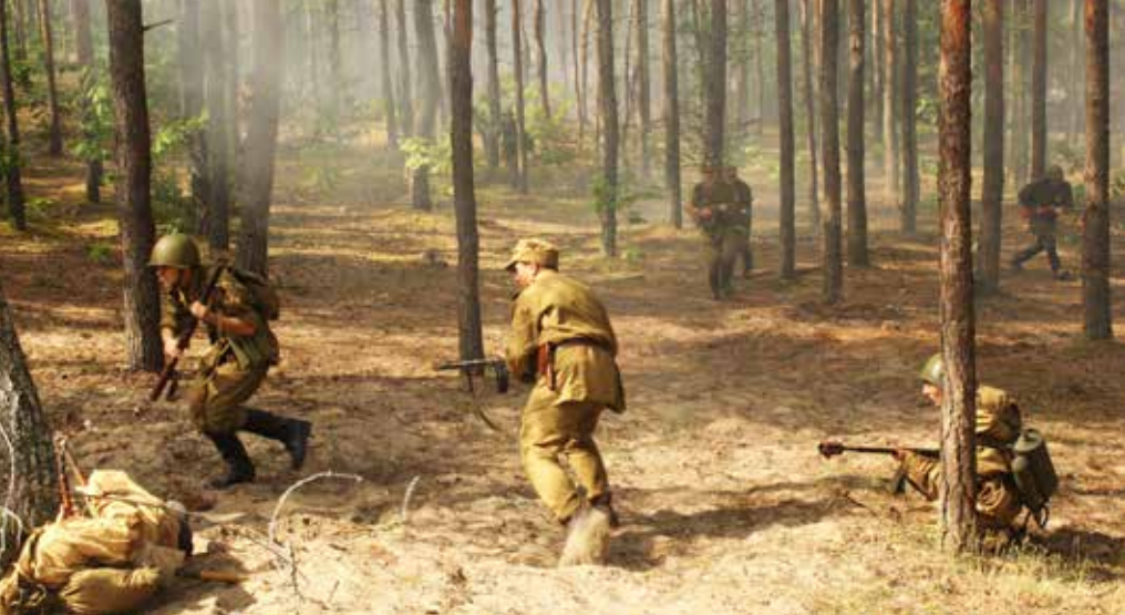
Atak wojsk radzieckich na schron niemiecki