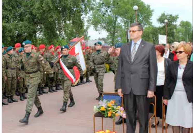
Uroczyste wprowadzenie sztandaru szkoły

Jak przystało na piknik, nie zabrakło wspaniałego poczęstunku. Smakosze grochówki z wojskowego kotła nie mogli narzekać, gdyż grochówka była wspaniała i wydawana bez jakichkolwiek ograniczeń. Oprócz grochówki były smakowitości z grilla oraz wspaniałe ciasta.(red)