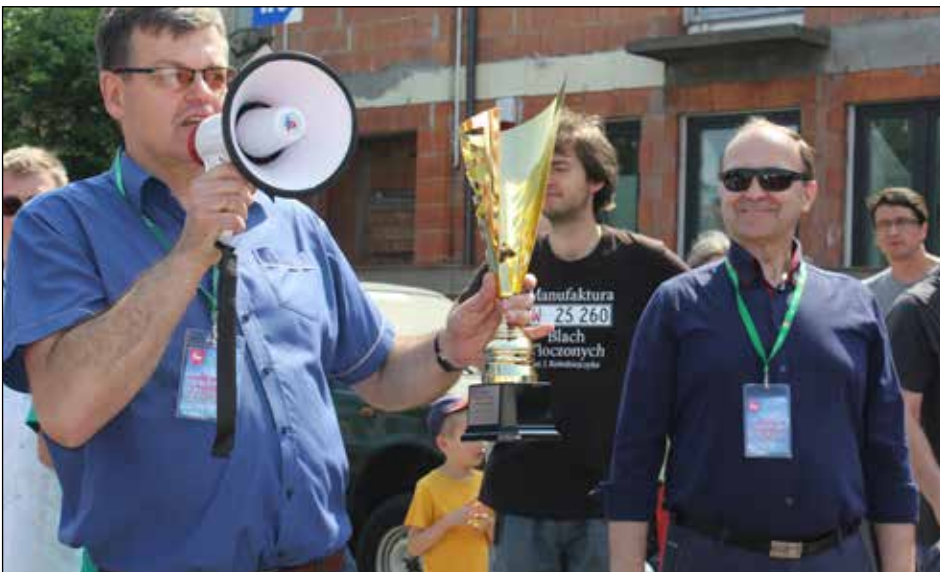
Burmistrz Karczewa przyznał specjalną nagrodę „Stylu i prestiżu”