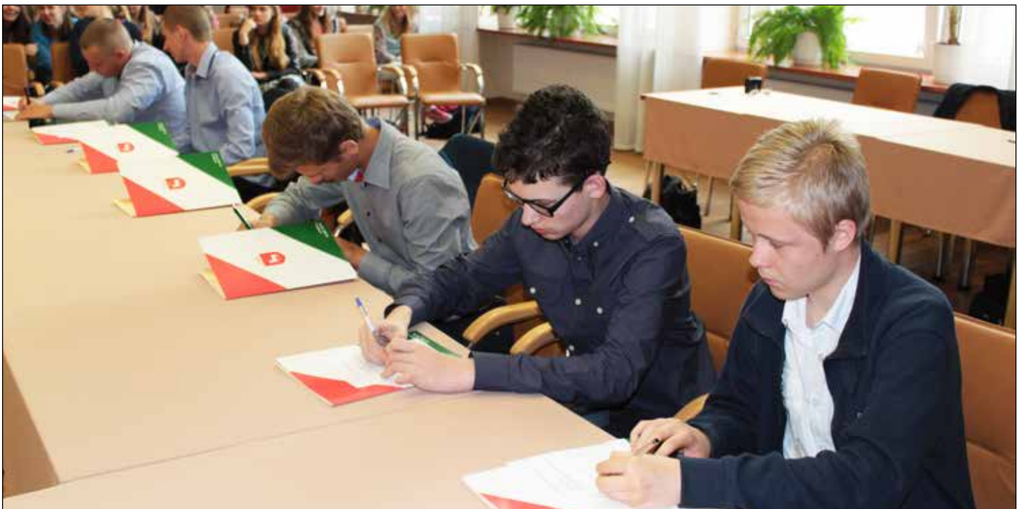
Podczas wyboru przewodniczącego rady