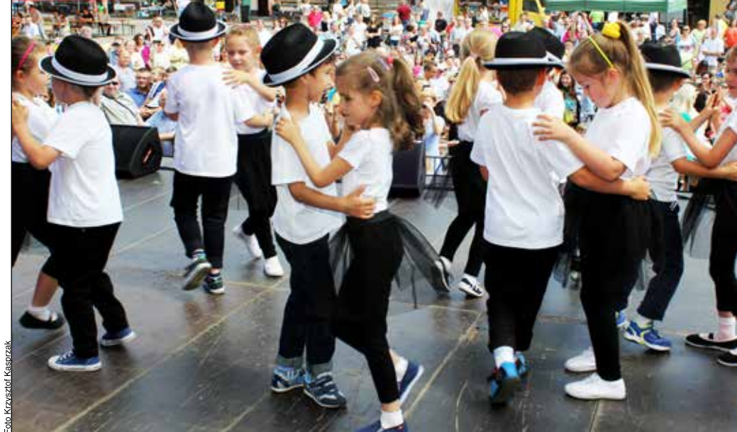
Tak tańczyły dzieci z przedszkola

Tegoroczne karczewskie święto zakończył wspaniały pokaz ogni sztucznych oraz zabawa taneczna, podczas której grał zespół „Fanaberie”.