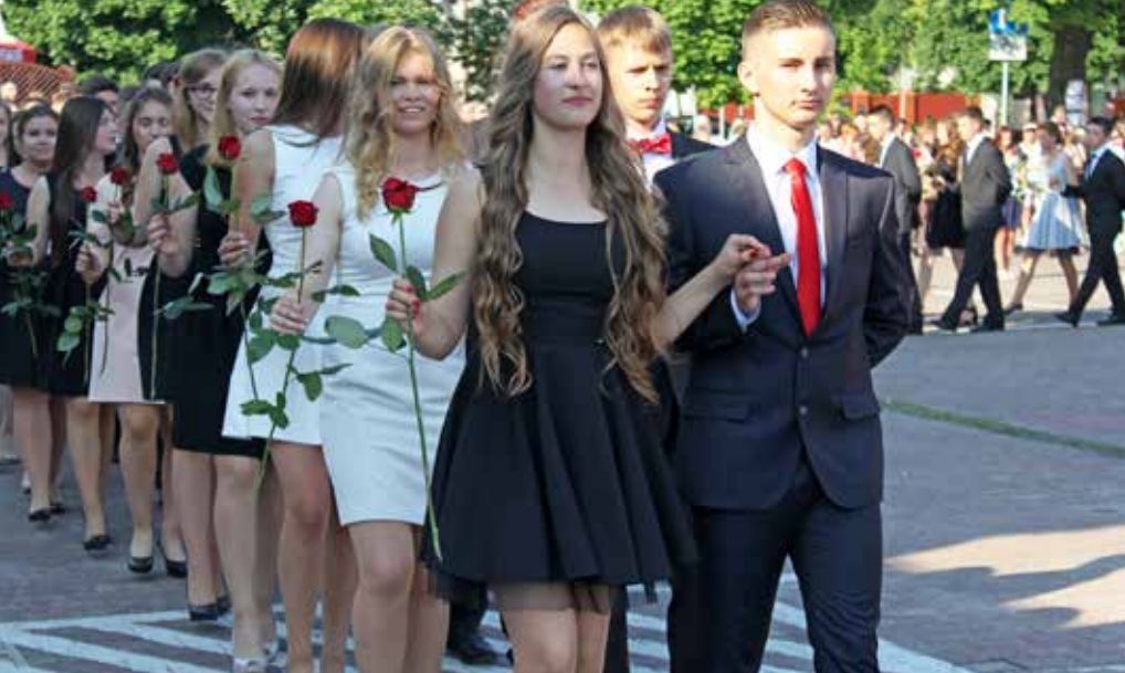
Gimnazjaliści podczas tradycyjnego poloneza