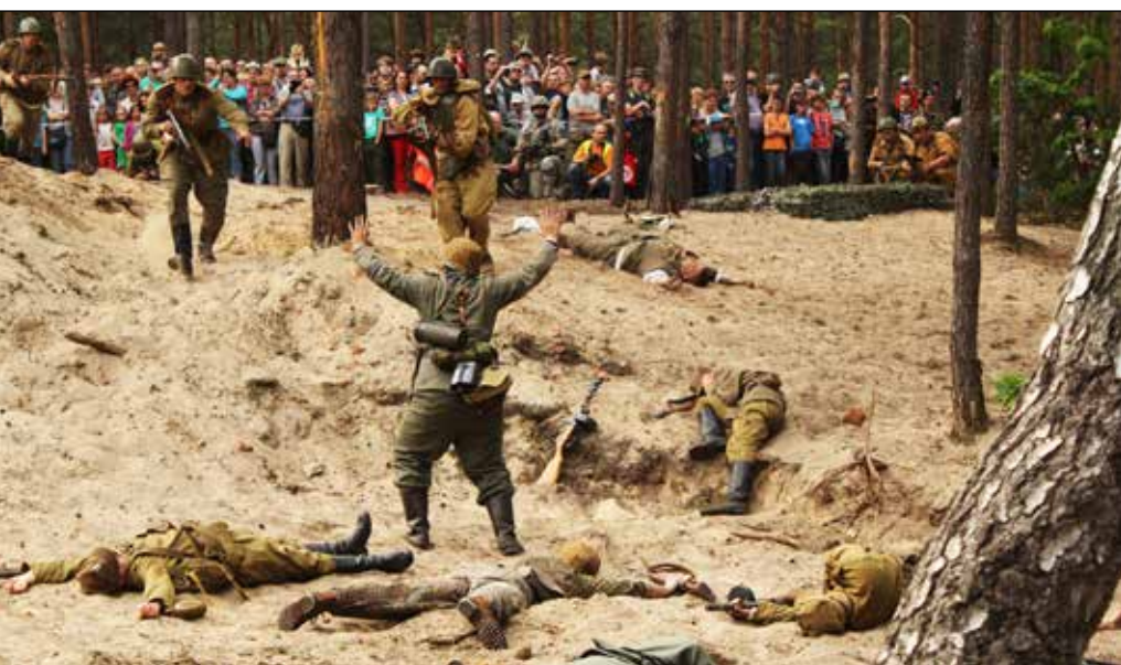
Ostatnie strzały przed zdobyciem schronu

Schrony na Dąbrowieckiej Górze przez wiele lat nie budziły większego zainteresowania. Były jedynie punktem orientacyjnym w lasach na terenie Gminy Karczew, celem wycieczek rowerowych i spacerów.